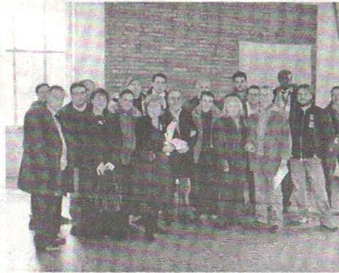
Alcuni dei partecipanti al progetto

gliono essere attori del loro futuro; un "tour dei paesi" e l'incontro con le popolazioni da parte di una equipe appositamente selezionata di esperti e imprenditori, provenienti da varie regioni italiane ed estere; Il tema del forum itinerante è "Il territorio che cambia e apprende". Ci sono stati stopping a Mirto Crosia, Campana, Cropalati e Mandatoriccio.